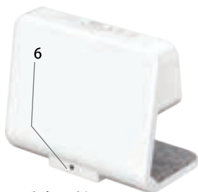
6. アダプター挿入口